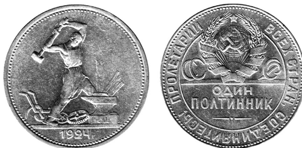
Серебряный полтинник образца 1924 г. (масштаб 150 %)

Согласно третьему пункту договора, по окончании чеканки маточники и формы должны были быть сданы советскому представителю, а штампы обезличены на монетном дворе в присутствии советского представителя 20 . По всей видимости, все маточники и формы, полученные от торгпредства, были возвращены. Однако КМД и торгпредство договорились, что первый сохранит у себя маточники и формы, изготовленные в Англии, на случай будущих заказов, и 5 маточников, 2 формы и 80 штампов были запечатаны в коробку и оставлены на монетном дворе 21 . Два года спустя торгпредство попросило вернуть эту коробку, что и было сделано 30 мая 1927 г. 22